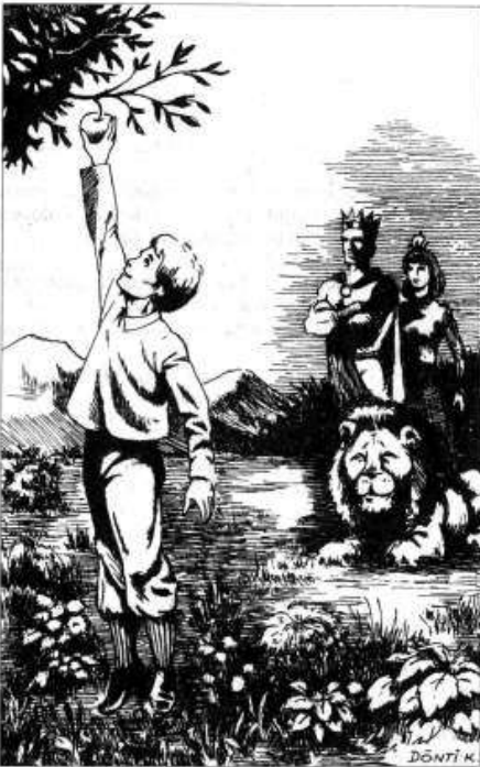
Aslan így is megértette.

— Akkor hát megérted, hogy meggyógyította volna, de sem neked, sem neki nem lett volna benne öröme. Rátok virradt volna az a nap, mikor mindketten, te is, ő is, visszatekintve azt mondjátok, bár inkább halt volna meg abban a betegségben.